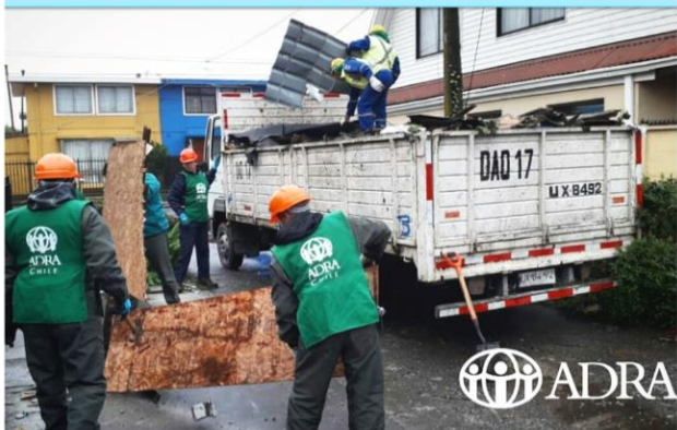
VOLUNTARIOS ADRA DESPLEGADOS EN LA ZONA AFECTADA