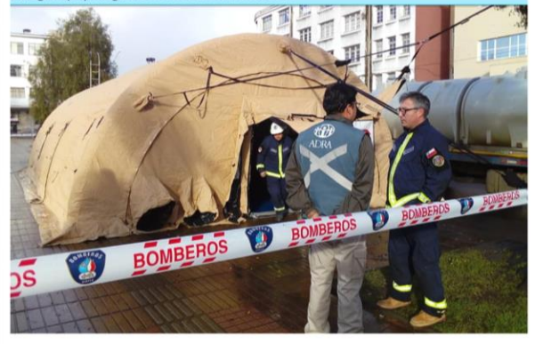
En el contexto de la emergencia sanitaria, voluntarios de ADRA son parte en el Comité Operativo de Emergencia (COE) conformado en la ciudad de Osorno, con el fin de entregar apoyo logístico a las autoridades. JULIO