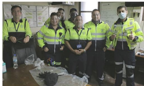
Para el año 2021 seguiremos trabajando en nuevos rubros como el área de tecnología y proyectos con Gobiernos regionales.

También hemos dado un paso importante en la construcción del Centro Logístico en Curacaví con una superficie de 1000 m 2 de construcción con una inversión de 480 millones de pesos. Dicho Centro está ubicado en un lugar estratégico con acceso inmediato a las rutas que van hacia el norte o sur de nuestro país. Funcionará como un centro de stock de materiales de primera necesidad. En caso de emergencias, se activará el protocolo de acción con los voluntarios con los que ADRA trabaja cada vez que se los necesita y estará a disposición de la Iglesia Adventista del Séptimo Día, si así lo requiere.